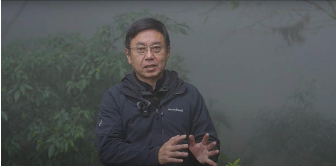
農業部林業及自然保育署の林華慶署長

締結式に出席した林署長は、連盟発足よりもかなり前から「龍谷の森」に興味を抱き、2012 年に見学 にいらしていました。「龍谷の森」が続けてきた自然共生型の地域連携、大学と地域社会の共同管理の 取り組みに、大きな感銘を受け、台湾の森林施策の参考にされたそうです。