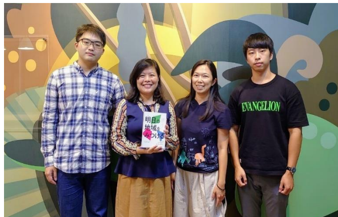
圖 2：2020 年初由兩位留日教師與具日語 N2 以上能力學生組成導讀小組

因此，暨大 2020 年的階段目標為建立校內「師生共學」的文化氛圍。我們規劃一系列社群前導活動，使參與者逐步熟悉臺日國際合作的運作模式，並評估設計相關課程合作的可能性。於是，2020 年 5 月四人師生小組成立，翻譯並摘要 信州大學於長野縣的地方實踐成果 ，協助有意願投入臺日合作的暨大教師探詢可能的學術或課程合作夥伴。