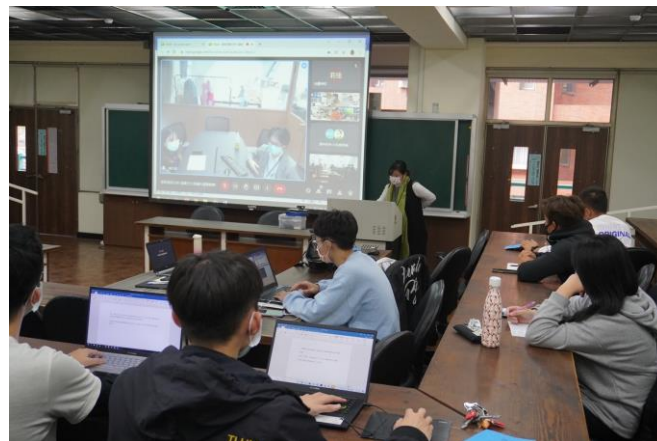
圖 4：第二年於暨大師生於校內課堂進行課程；企業與信大師生線上參與

相較於第一年的開放式討論，第二年學生的回應不僅更具創意，也展現出較高的可行性與實務連結性。惟課程安排於晚間進行，一定程度上限制了日本學生的參與人數，成為後續課程規劃中需持續調整的面向。