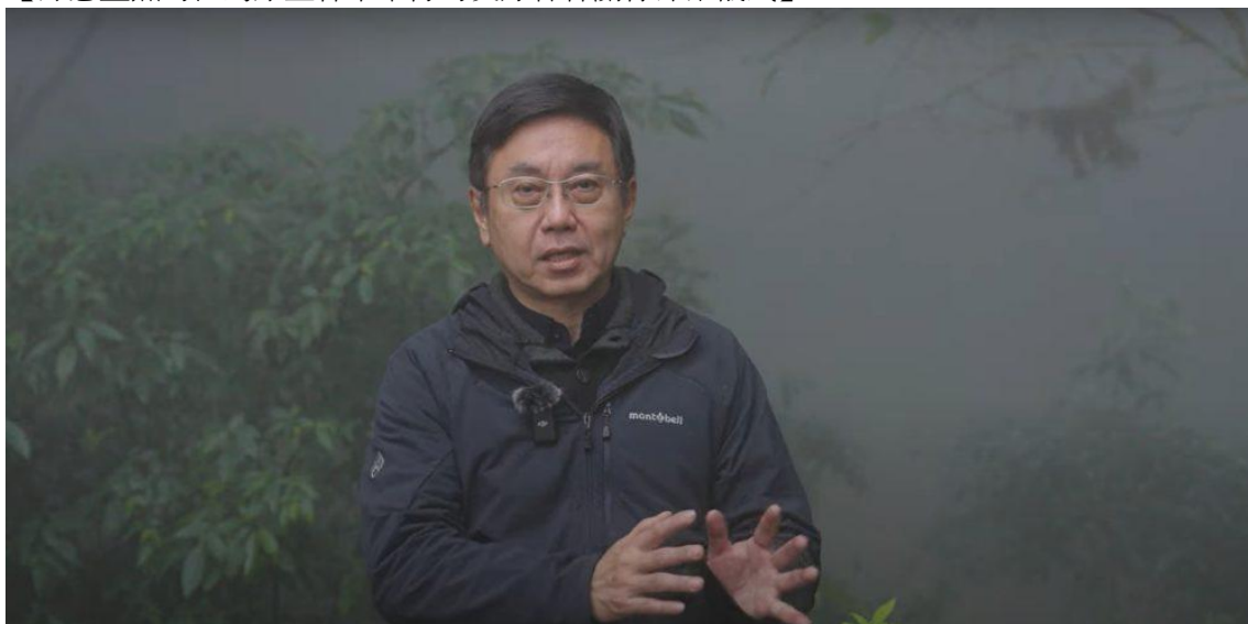
台灣農業部林業及自然保育署的林華慶署長

出席於締結儀式的林華慶署長，其實早在該聯盟成立之前，就對「龍谷之森」抱有興趣，並於2012年進行參訪。他對「龍谷之森」長期推動的自然共生型地方合作，及大學與地方社會共同管理的做法深受啟發，並將其作為台灣森林政策推行的參考。