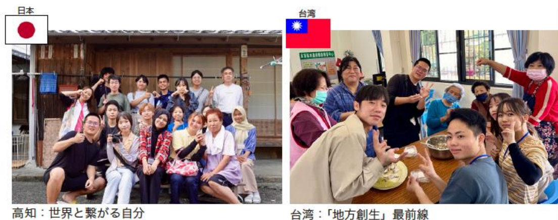
圖 台日聯盟實施之教育學程

近年來，日本增加了許多外國人技能實習生及海外觀光客，逐漸形成多元文化共生社會，全球化的浪潮也來到我們所在的高知縣。全球化、人口減少、高齡化等問題複雜的高知縣，由於地方層級至國際議程 (SDGs 等) 的推進，以及與海外的地方社會建立關係，衍生出需要能夠由「全球」與「在地」雙重視角推動國際化的人才，為迎接此新挑戰，高知大學推出「全球在地化創生規劃師」。